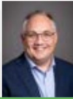
JODY STONE MAIRE - MAYOR